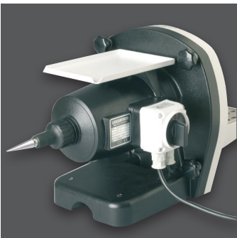
HSS-ZA, rückseitig mit Polierspindel und praktischem Edelstahlablagetisch