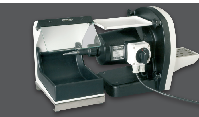
HSS-ZA Poliertrog mit oder ohne Absaugstutzen, als Zubehör erhältlich